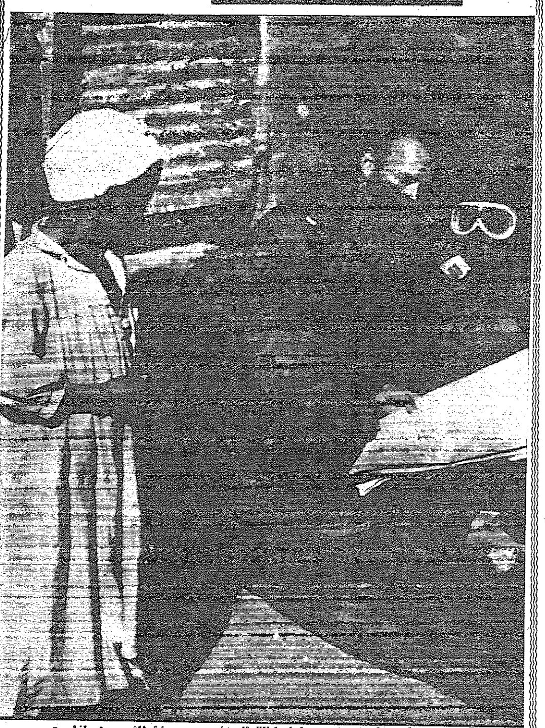
صورة من صحراء سيناء وضعت لها وكالة اليونانديرس هذا الشرح: طفل يتحسس لملاده (٧ سنوات) ... انه يخلس النظر الى خارطة يجعلها جندي اسرائيلي ... الخارطة في الواقع ليست ذات قيمة وثائقية ولا هي خارطة سرية ... انها خارطة عادية للموقع في خيمة بدوية انشاء عملية اعضاء اللدو في صحراء سيناء